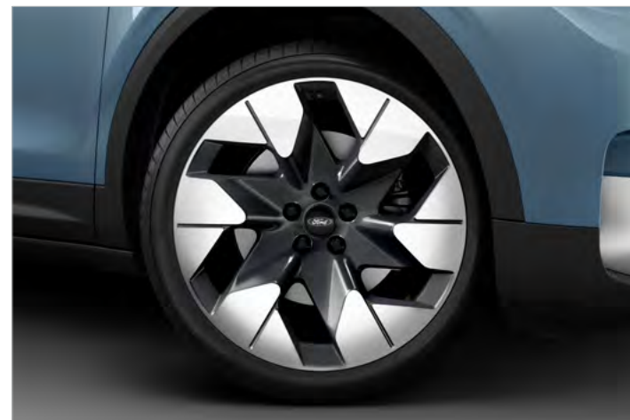
20" OBRĘCZE KÓŁ ZE STOPÓW LEKKICH, OGUMIENIE: PRZÓD 235/50, TYŁ: 255/45 Standard dla wersji PREMIUM