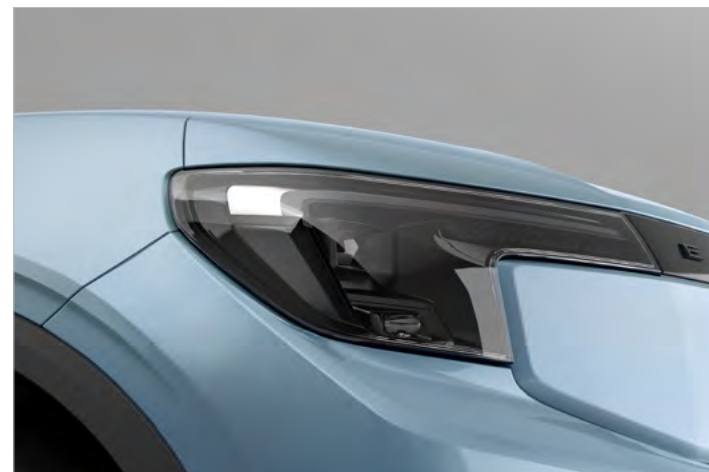
REFLEKTORY MATRYCOWE W TECHNOLOGII LED Standard dla wersji PREMIUM