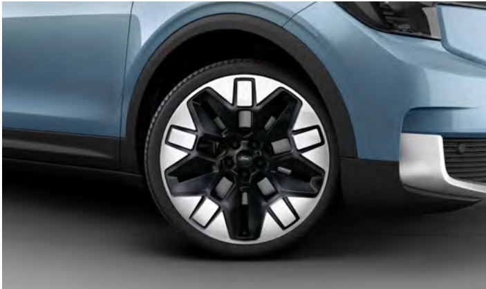
21" OBRĘCZE KÓŁ ZE STOPÓW LEKKICH Opcja dla wszystkich wersji