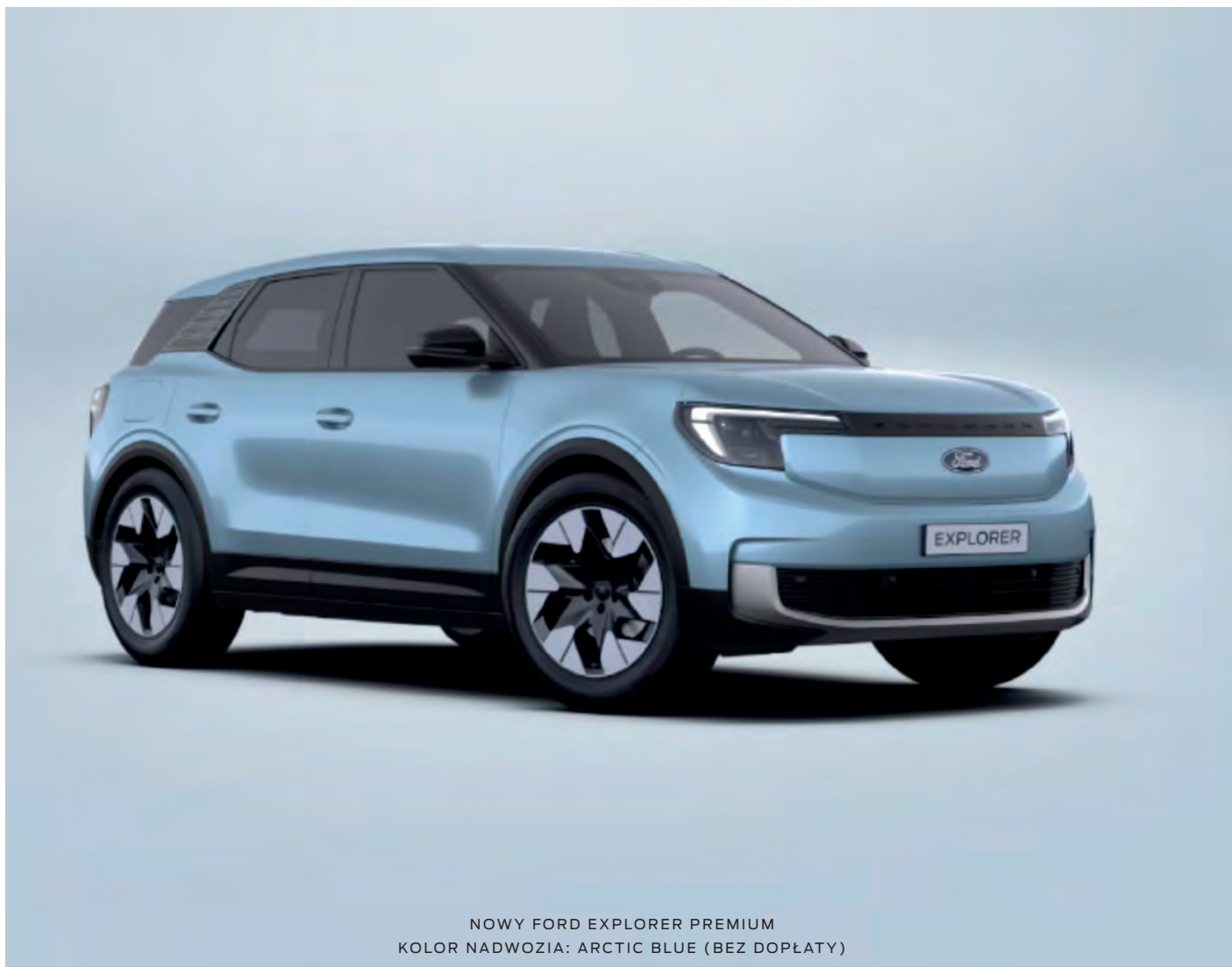
NOWY FORD EXPLORER PREMIUM KOLOR NADWOZIA: ARCTIC BLUE (BEZ DOPŁATY)