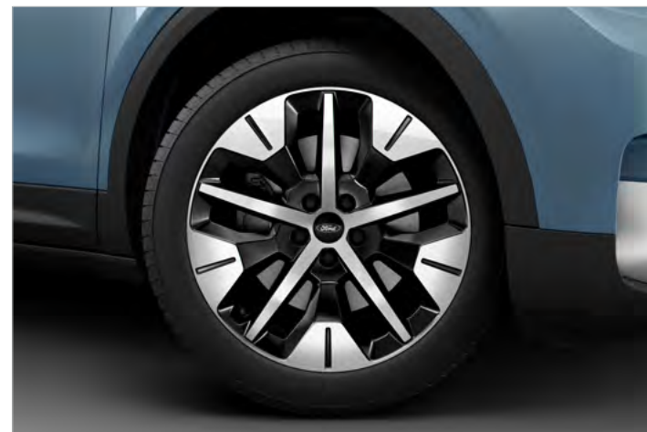
19" OBRĘCZE KÓŁ ZE STOPÓW LEKKICH, OGUMIENIE: PRZÓD 235/55, TYŁ: 255/50 Standard dla wersji EXPLORER