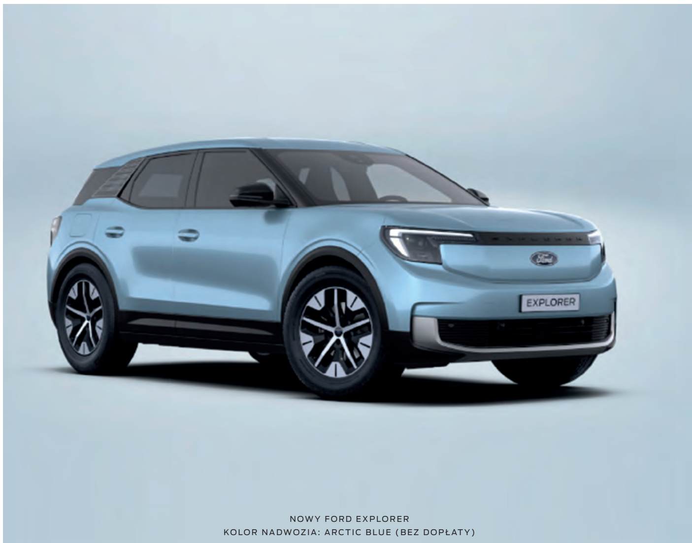
NOWY FORD EXPLORER KOLOR NADWOZIA: ARCTIC BLUE (BEZ DOPŁATY)