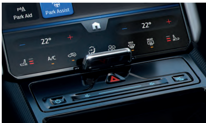
POMPA CIEPŁA Opcja dla wszystkich wersji