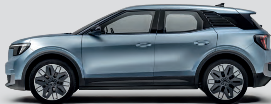
DŁUGOŚĆ CAŁKOWITA: 4468 mm