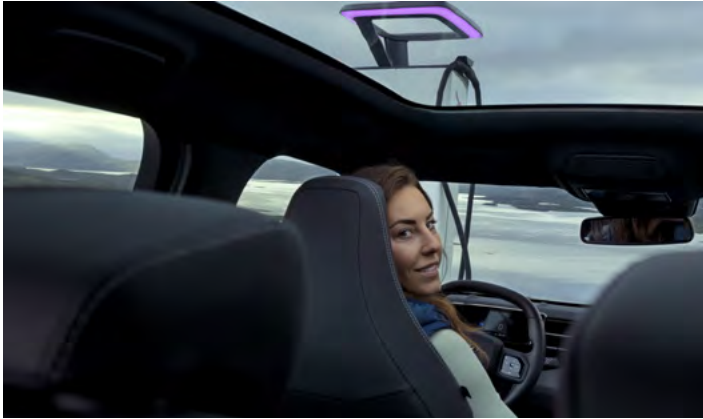
DACH PANORAMICZNY Opcja dla wersji PREMIUM