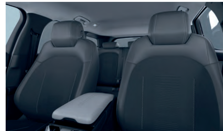
PRZEDNIE FOTELE ERGONOMICZNE, Z CERTYFIKATEM AGR, Z TAPICERKĄ CZĘŚCIOWO SKÓRZANĄ (SENSICO / ETON BLACK ONYX) Opcja dla wszystkich wersji