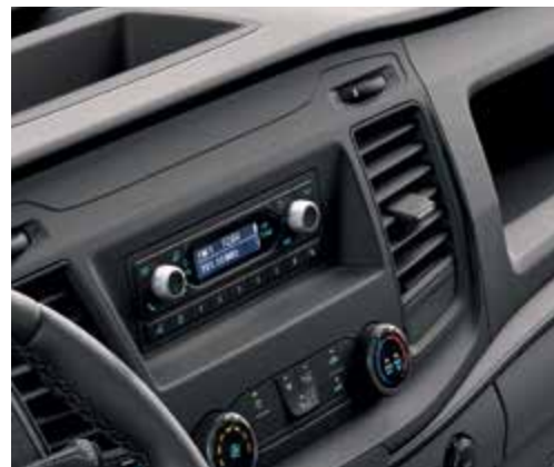
Radio w standardzie 1DIN z DAB+