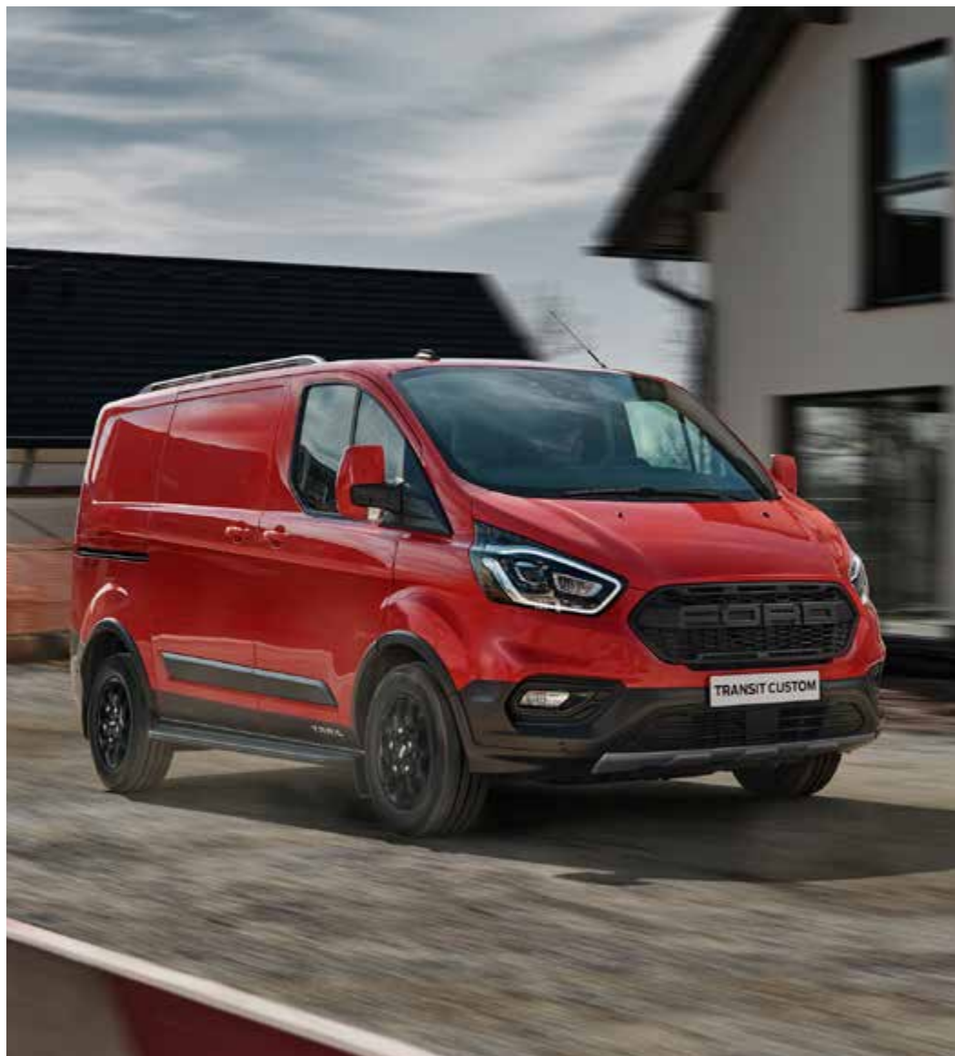
Ford Transit Custom Van Trail w kolorze Race Red (bez dopłaty)