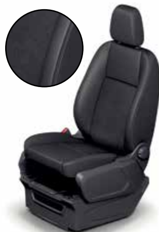
INROAD - Tapicerka materiałowa