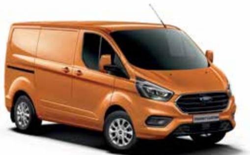
ORANGE GLOW - lakier metalizowany 2 500,- | niedostępny dla wersji Trail