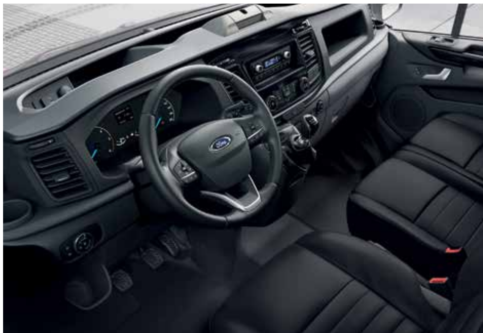
Ford Transit Custom VAN Trail