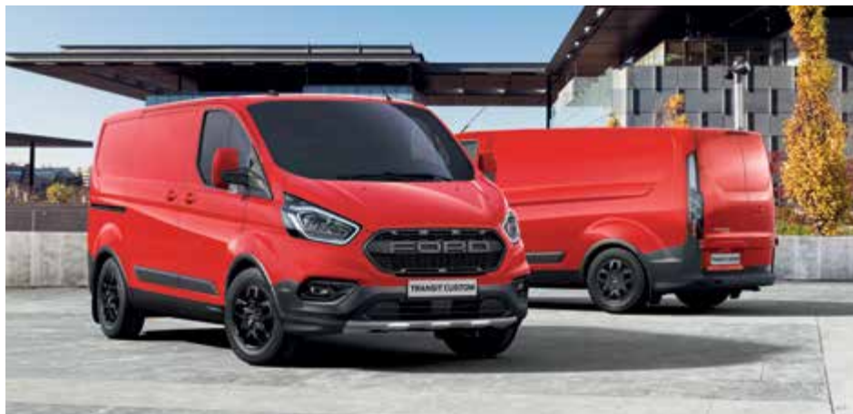
Ford Transit Custom VAN Trail w kolorze Race Red (bez dopłaty)