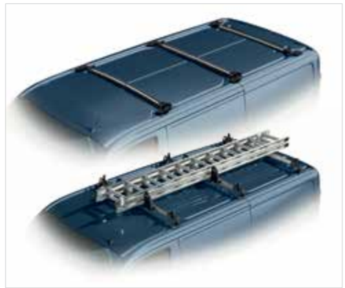
Zintegrowany bagażnik dachowy - składany

TREND | LIMITED | SPORT | TRAIL Standard