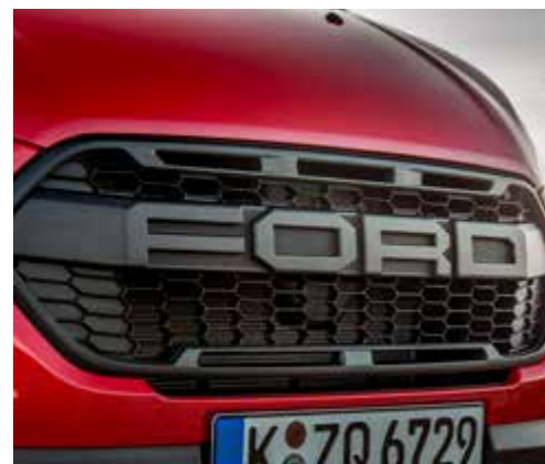
Unikalna krata wlotu powietrza z napisem „F O R D”