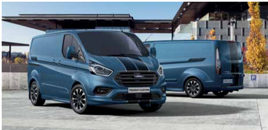
Ford Transit Custom VAN Trend w kolorze Race Red (bez dopłaty)