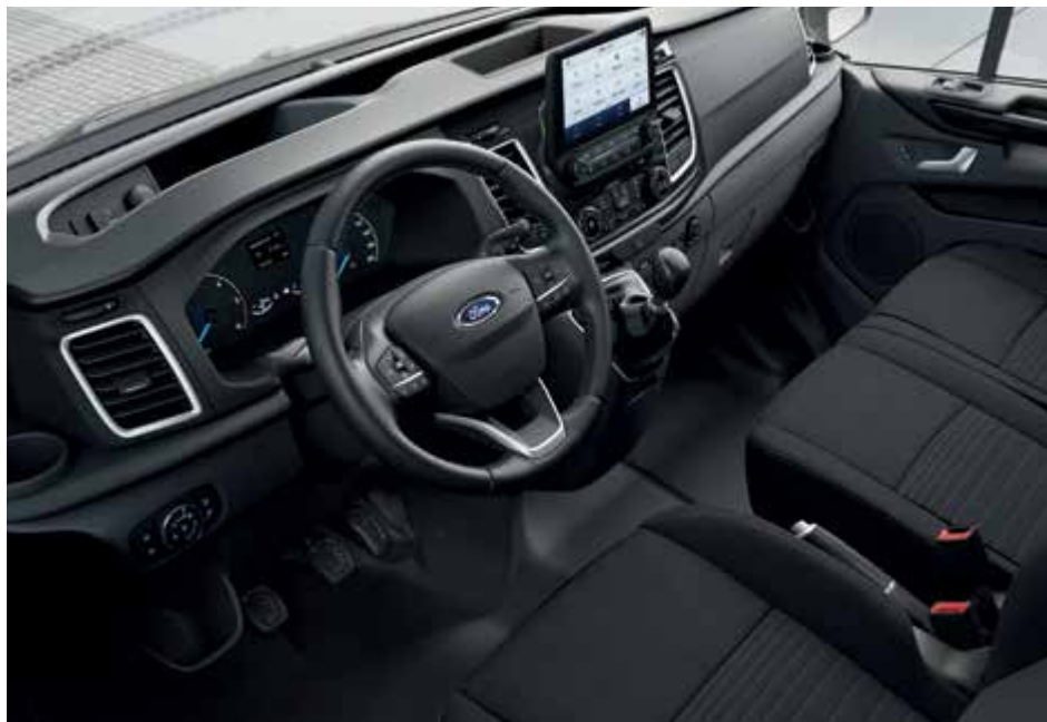
Ford Transit Custom VAN Trend