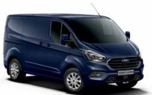
BLAZER BLUE - lakier zwykły bez dopłaty | niedostępny dla wersji Trail