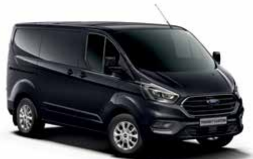
AGATE BLACK - lakier metalizowany 2 500,-