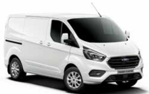
FROZEN WHITE - lakier zwykły bez dopłaty