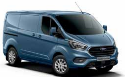
CHROME BLUE - lakier metalizowany 2 500,-