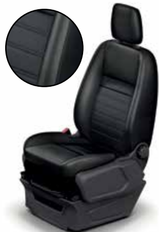
SALERNO - tapicerka skórzana