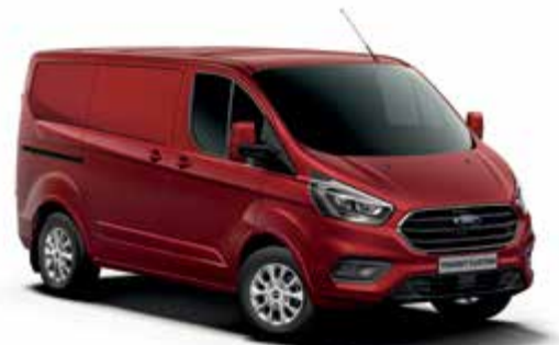
DARK CARMINE RED - lakier metalizowany 2 500,-