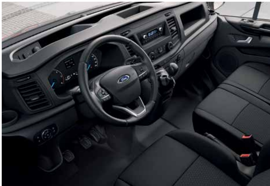
Nowy Ford Transit Custom VAN Trend