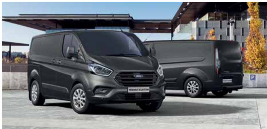
Nowy Ford Transit Custom VAN Limited w kolorze Magnetic Grey (opcja)