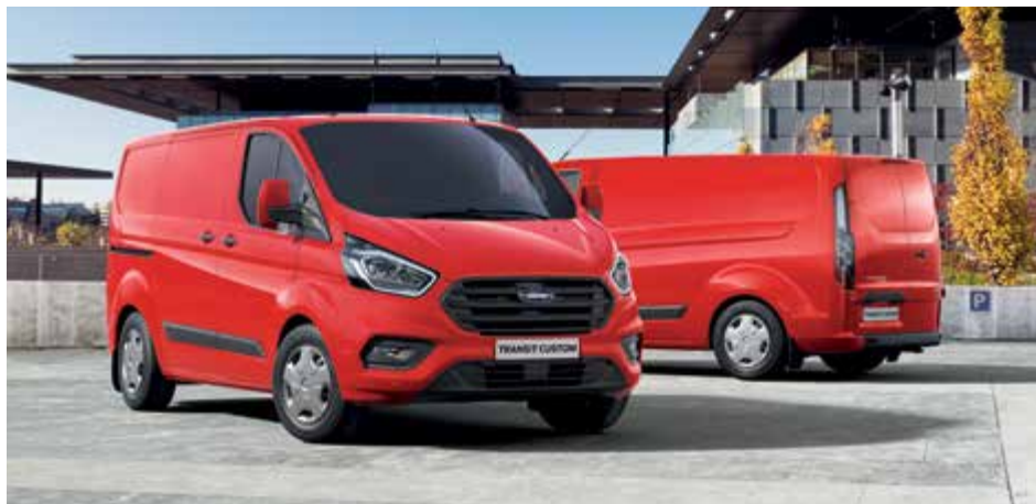
Nowy Ford Transit Custom VAN Trend w kolorze Race Red (bez dopłaty)