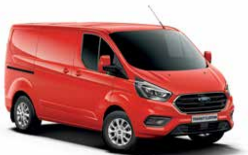
RACE RED - lakier zwykły bez dopłaty