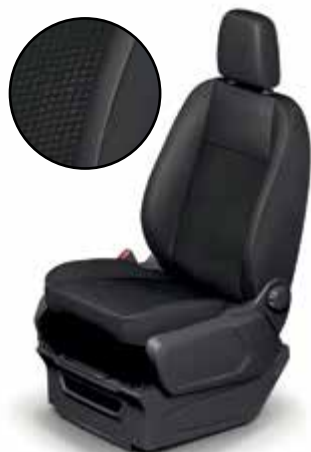
DYNAMIC - Tapicerka częściowo skórzana