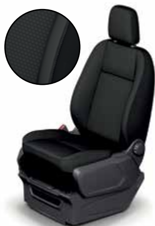
CAPITOL - Tapicerka materiałowa