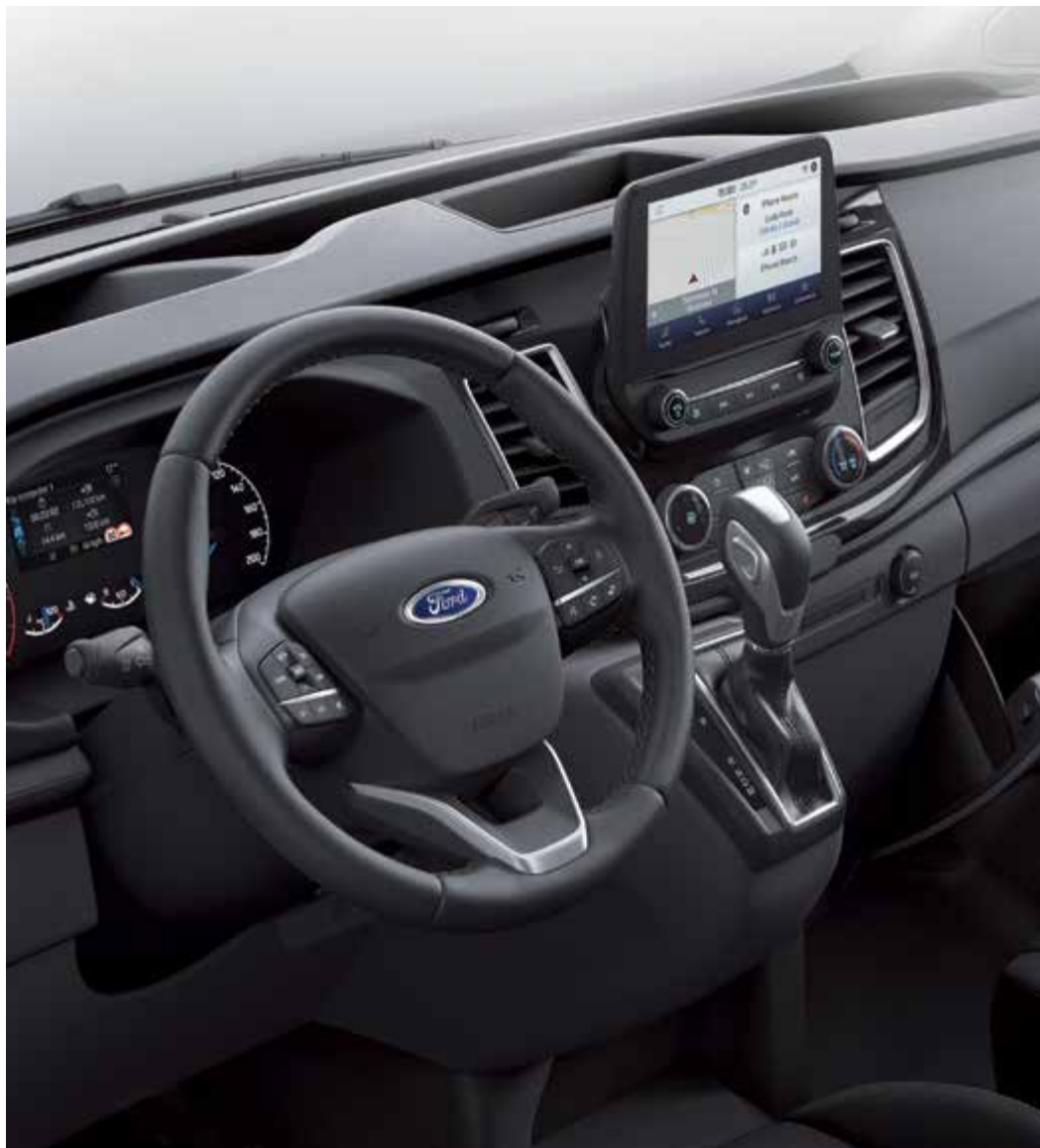
Ford Transit Custom Van Limited z systemem nawigacji satelitarnej (ICE PACK 25) (opcja)