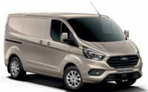
DIFFUSED SILVER - lakier metalizowany 2 500,- | niedostępny dla wersji Trail