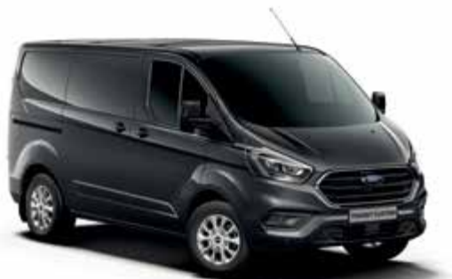
MAGNETIC GREY - lakier metalizowany 2 500,- | niedostępny dla wersji Trail