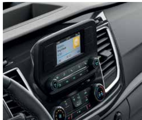
Radio My Connection z DAB+ z 4,2" kolorowym wyświetlaczem