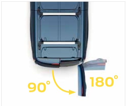
Łatwy dostęp do przestrzeni ładunkowej

TREND | LIMITED | SPORT | TRAIL Standard