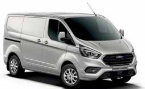
MOONDUST SILVER - lakier metalizowany 2 500,-