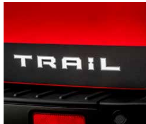
Ochronne naklejki z napisem „TRAIL” po bokach i z tył